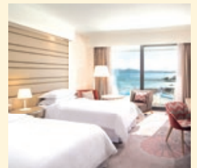
Hotel Sheraton Dubrovnik Riviera, Srebreno, Zimmerbeispiel