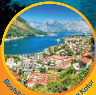
Bootsfahrt in der Bucht von Kotor

5 UNESCO- Welterbestätten, Halbpension & 5 Ausflüge inklusive!