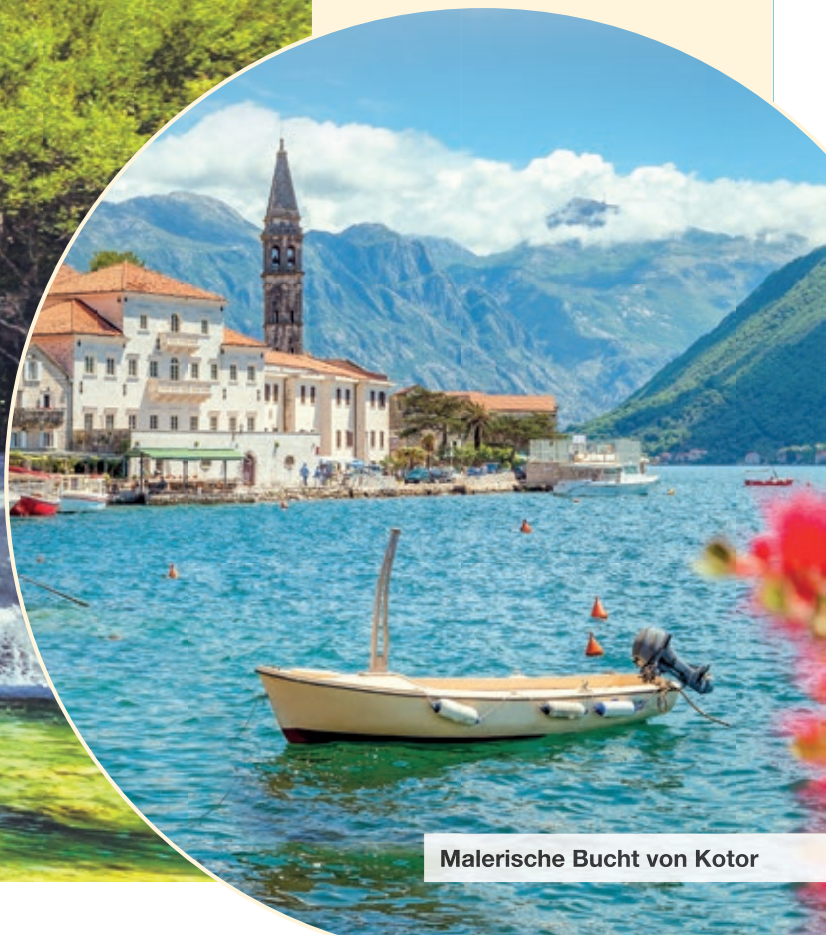
Malerische Bucht von Kotor