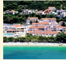
Bluesun Holiday Village Afrodita, Tučepi