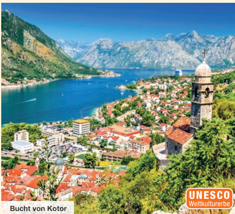
Bucht von Kotor