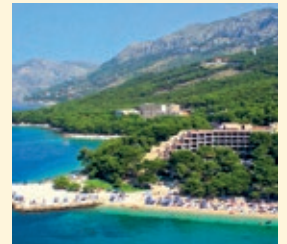
Bluesun Hotel Soline, Brela