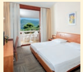
Tirena Sunny Hotel by Valamar, Dubrovnik, Zimmerbeispiel