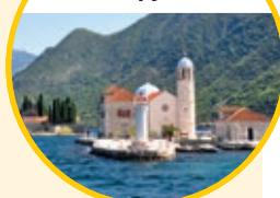
Gospa od Škrpjela

Dieser Tagesausflug führt Sie zu einem echten Sehnsuchtsziel im Nachbarland Montenegro: Mit dem Bus geht es nach Herceg Novi, wo Sie an Bord eines exklusiv für trendtours -Gäste gecharterten Ausflugsbootes gehen. Sie entdecken auf einer mehrstündigen Erlebnis-Bootsfahrt die einmalige landschaftliche Schönheit der Bucht von Kotor. Die sich tief in die silbergrauen Berge grabende Bucht verzaubert Sie mit atemberaubenden Panoramen – man könnte sich an einen norwegischen Fjord versetzt fühlen, wären da nicht die südliche Sonne und die azurblaue Adria. Dank der geschützten Lage zwischen den mächtigen Bergen entwickelten sich die Hafenstädte hier schon in der Antike zu bedeutenden Handelszentren mit ausgeprägt mediterranem Flair: Sie erleben mit einem örtlichen deutschsprachigen Stadtführer Sehenswürdigkeiten wie die Festungsstadt Kotor, entdecken das durch Kapitänsvillen geprägte Perast und besuchen das romantische Kirchen-Inselchen Gospa od Škrpjela. Lassen Sie sich von der spektakulären Naturkulisse und den idyllischen Küstenstädtchen dieses einzigartigen Mittelmeer-Fjordes verzaubern!