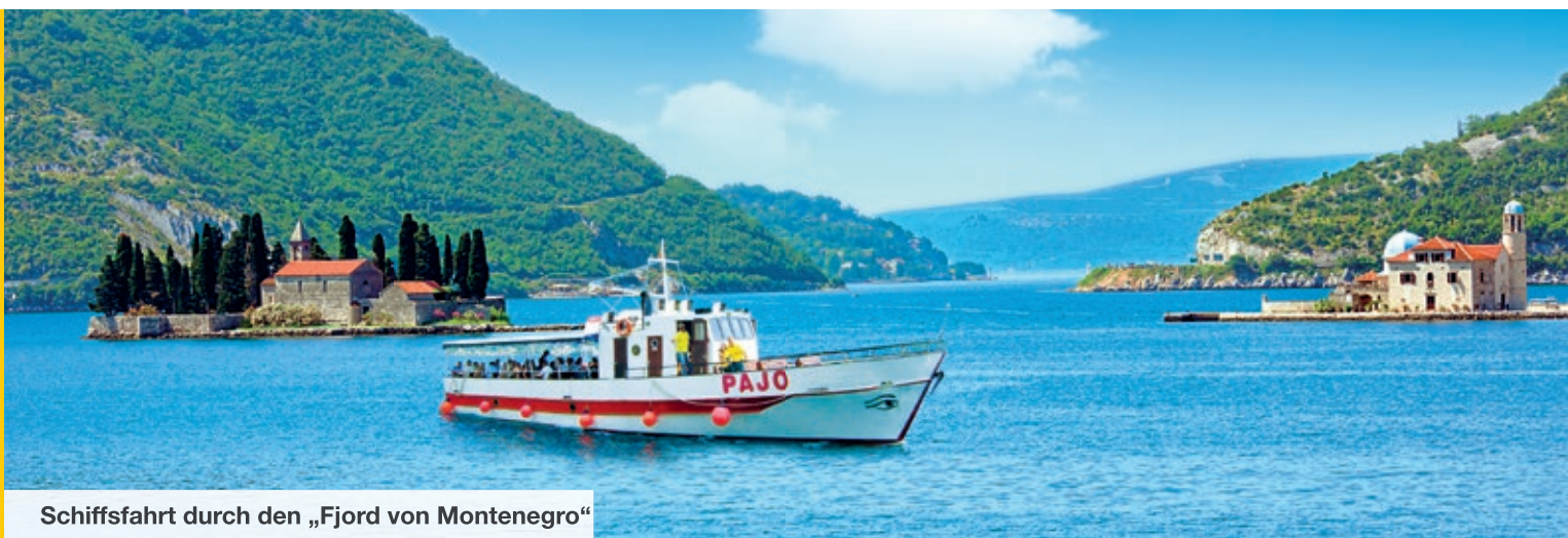
Schiffsfahrt durch den „Fjord von Montenegro“