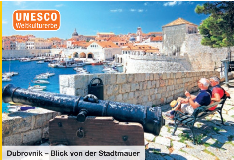
Dubrovnik – Blick von der Stadtmauer