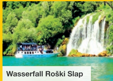
Wasserfall Roški Slap