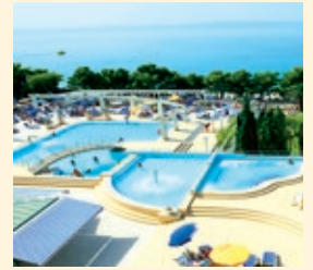
Bluesun Hotel Alga, Tučepi