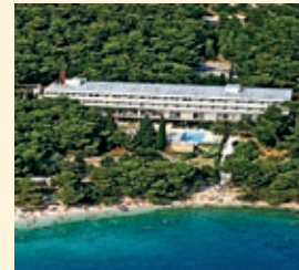
Bluesun Hotel Maestral, Brela