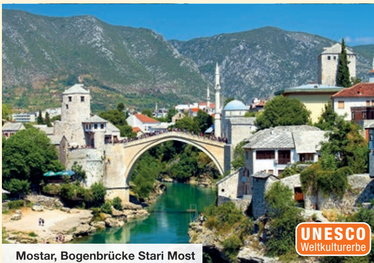
Mostar, Bogenbrücke Stari Most

Auf Ihrer Fahrt zurück an die Makarska-Riviera entdecken Sie zuerst die landschaftlichen Schönheiten der Bergwelt der Herzegowina. Danach erwartet Sie eine Sehenswürdigkeit von Weltrang: Mit einem örtlichen deutschsprachigen Stadtführer entdecken Sie Mostar, das historische Herz der Herzegowina, und besichtigen ihr Wahrzeichen, die berühmte Bogenbrücke Stari Most. Die „alte Brücke“ aus dem 16. Jahrhundert spannt sich in einem 19 Meter hohen Bogen über den smaragdgrünen Fluss Neretva. Dieses osmanische Meisterwerk der Baukunst gilt seit seiner Wiedereröffnung 2004 als Symbol der Versöhnung. Hier ist die Heimat der berühmten Brückenspringer, die sich nach jahrhundertealter Tradition mutig in die Tiefe stürzen. Zurück in Kroatien genießen Sie noch zwei Nächte an der schönen Makarska-Riviera und entspannen an der blauen Adria.