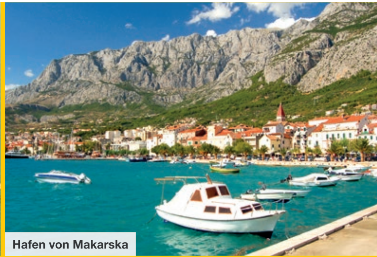
Hafen von Makarska