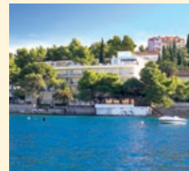
Hotel Cavtat, Cavtat